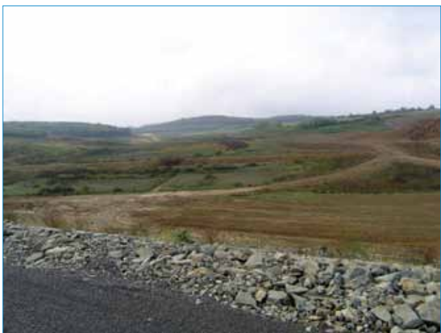
Prostor budućega akumulacijskog jezera Koritnjak

Prvi su radovi na gradnji akumulacije obavljani 2007. kada je izgrađena pristupna cesta iz Bučja Gorjanskog, a potom se nastavilo s krčenjem u akumulacijskom prostoru i na području pregrade te uređenju odvodnih kanala koji su omogućili kontroliranu odvodnju i isušivanje cijelog prostora namijenjenog gradnji brane i pripadajućih građevina. Krajem 2009. započeli su pravi radovi, a u 2010. bilo je, kako je već rečeno, mnogo problema s obilnim kišama, ali i s podzemnim vodama.