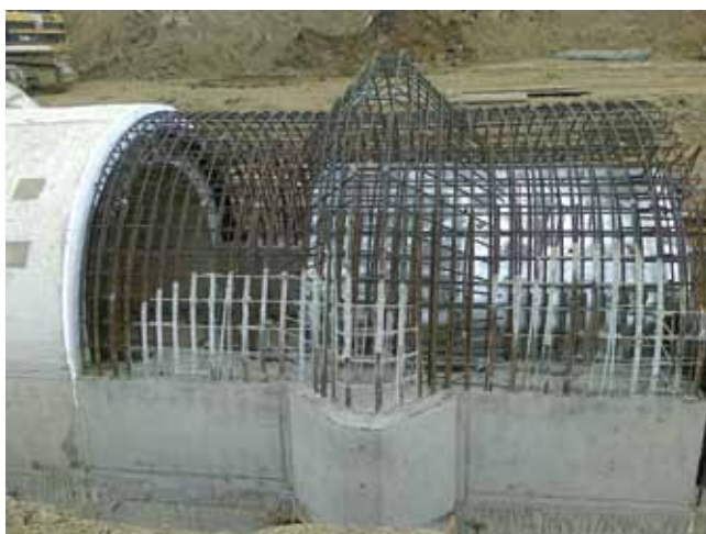
Betoniranje temeljnog ispusta brane

Brana je praktički pred završetkom, a na gradilištu su provedeni dodatni iskopi u