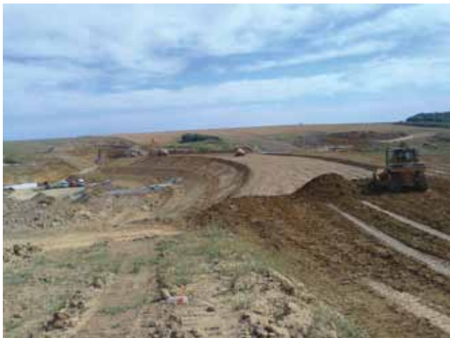
Gradnja zemljane brane Koritnjak