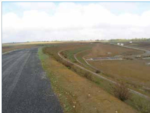
Pogled s desnog boka na praktički izgrađenu branu Koritnjak

Tada je gotovo nemoguće raditi pa se radovi moraju prekidati i pričekati da se sve osuši. Posljednje su dvije godine bile vrlo dobre što se tiče oborina i kišna su se razdoblja svela na samo dva mjeseca.