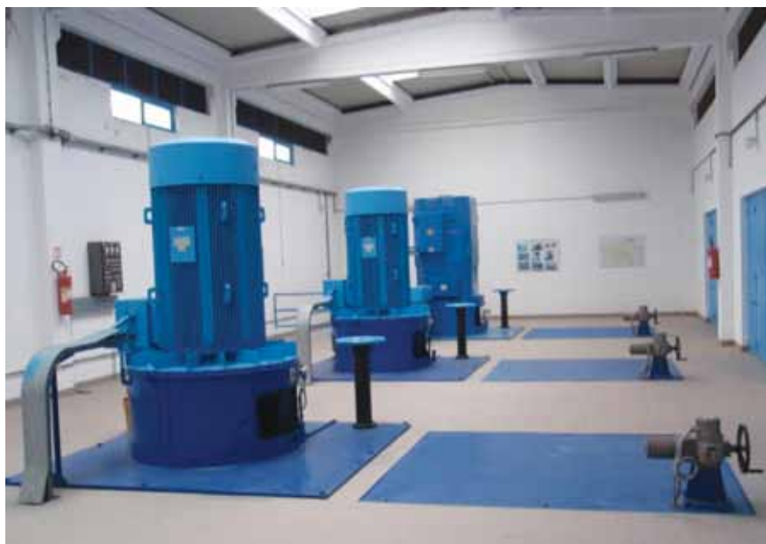
Obnovljeno postrojenja velike crpne stanice Dvor

Sličan je slučaj i sa susjednim slivom Karašica-Vučica koji se prostire u Virovitičko-podravskoj i Osječko-baranjskoj županiji i gdje je tijekom 20. st., ponajviše zaslugom prof. Stjepana Belle, uglavnom uspješno rješavana zaštita od poplava sustavom brojnih kanala. No tu je situacija ponešto drugačija jer je korito Drave znatno ispod razine okolnog zemljišta, tako da su glavna poplavna prijetnja tzv. unutarnje vode, uglavnom od brojnih bujičnih s Papuka i Krndije. Za taj smo sliv iz raznovrsnih izvora nabrojili gotovo 40 planiranih i izvedenih akumulacija, mikroakumulacija i retencija od kojih su izvedene samo dvije: Lapovac II pokraj Našica i Javorica pokraj Slatine (gradnja prikazana u Građevinaru 9./2005.). Trenutačno se grade dvije (Seginac u općini Čačinci i Slanac u općini Voćin), a za neke je već pripremljena i projektna dokumentacija (Piljevačka glava, Breznica, Dubovik...). Valja međutim istaknuti da se kao retencije koriste i neke šume poput Izovače, Ražljeve i Prkosa te ribnjaci Grud-