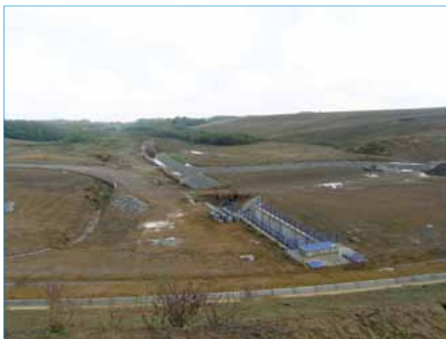
Temeljni ispust i uređeno korito potoka i bočnog preljeva