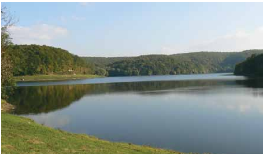
Umjetno jezero Borovik u gornje dijelu toka rijeke Vuke

Francuski vodoprivredni stručnjak Friedrich Wilhelm Toussaint angažiran je da predloži hidrotehničke zahvate na rijeci Vuki i za tri je mjeseca obišao cijelo područje