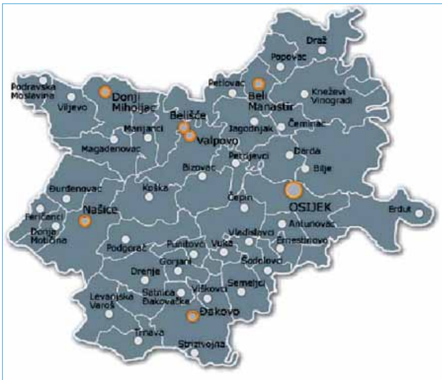
Gradovi i općine Osječko-baranjske županije (općina Drenje je sjeverozapadno od Đakova)

Sada se upravo gradi akumulacija Koritnjak na istoimenom potoku (ponegdje se navodi kao kanal), a na rijeci je Vuki studijskim rješenjima planirano još nekoliko akumulacija. Najveća je pod nazivom Bučje, sa zapreminom od čak 19,7 km 3 , planirana u koritu rijeke Vuke nizvodno od Borovika (dijelom i na području općine Podgorač). No pitanje je hoće li se ta golema akumulacija uopće