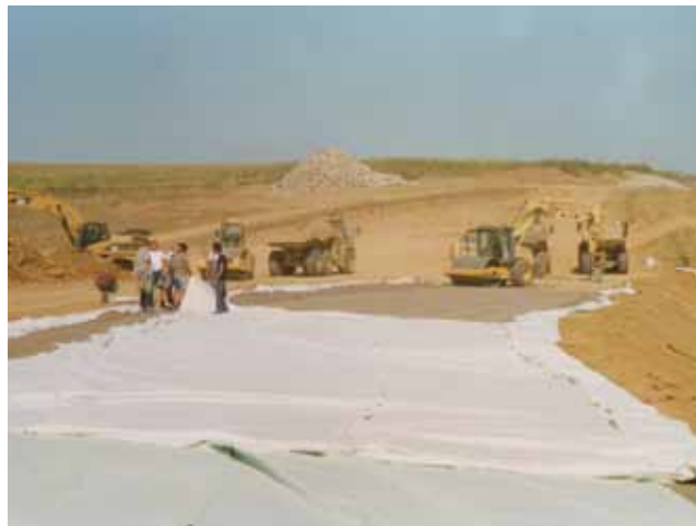
Ugradnja geotekstila u tijelo brane

desnom boku brane gdje je u cijelosti zamijenjen zatečeni pijesak zemljom koja je uglavnom uzimana iz nalazišta u budućem umjetnom jezeru. U prije provedenim istraživanjima znalo se da tu ima pijeska, ali su izvođača iznenadile zatečene količine što se vjerojatno moglo izbjeći opsežnijim geotehničkim istraživanjima koja su provedena kada su otkrivene znatnije količine pjeskovitog materijala. Obavljena su i mjerenja slijeganja kao i procjene stišljivosti, ali je i posebno provjereno brtvljenje u desnom boku i u području bočnog preljeva. Inače radovi su izvedeni vrlo solidno, unatoč činjenici da je 2010. bilo mnogo oborina koje su vrlo nepovoljne za gradnju nasutih zemljanih brana pa je u takvim slučajevima trebalo prekidati radove.