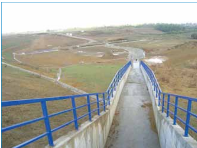
Pogled s brane na bočni preljev