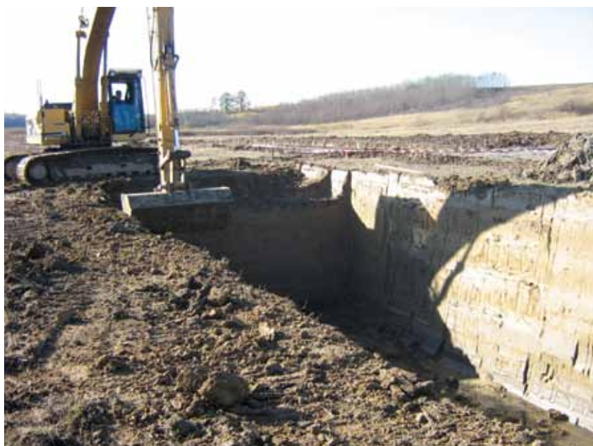
Prvi zemljani radovi u gradnji brane Koritnjak

najvećeg vodostaja kroz tijelo brane formirati procjedna linija koja bi izbila na nizvodni pokos, a visina bi ovisila o vodopropusnosti u vodoravnom i okomitom smjeru. U slučaju kada bi ta vodopropusnost bila jednaka, tada bi voda izbijala vrlo nisko i mogla bi se jednostavno spustiti podnožnim drenom u nožici brane. No problemi bi mogli nastati kada bi, primjerice, vodoravna propusnost bila deset puta veća od okomite, tada bi voda izbijala vrlo visoko i ugrozila stabilnost brane. Stoga se unutar nizvodnog dijela tijela brane i izvode tri drenažna tepiha koji će omogućiti da se procjedna voda u tijelu brane prihvaća i gravitacijski odvodi na berme. Da je ta linija presječena središnjim drenom, nizvodni bi dio bio suh i bez vegetacije u