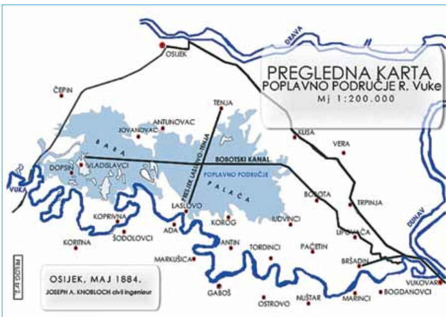
Plan isušivanje močvara Palača i Kolođvarska bara

Kreutzerov projekt je Zadruga za regulaciju rijeke Vuke prihvatila 1893., a Zemaljska vlada 1894., da bi 1985. započeli hidromelioracijski i regulacijski radovi koji su trajali sve do 1925. godine. Najprije je produbljen Kolođvarsko-bobotski kanal, a potom regulirano korito Vuke koje je očišćeno od mulja i raznovrsnog bilja. Potom je od 1900. do 1903. u općinama Čepin, Tenja, Dopsin i Hraštin prokopan sustav kanala za otjecanje suvišnih voda. Do 1920. ponovno je produbljen i potom proširen Kolođvarsko-bobotski kanal, a dodatnom regulacijom korito je Vuke postalo dublje od močvare Palače što je u konačnici u godinama nakon Prvog svjetskog rata uspješno pridonijelo njezinu isušivanju. Kanali i nasipi bili su prilično zapušteni tijekom Drugoga svjetskog rata, a na-