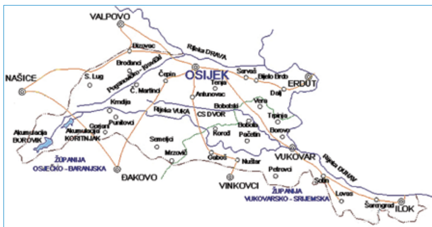
Slivno područje rijeke Vuke

Porječje je Vuke smješteno u jugozapadnom dijelu Panonske nizine, odnosno istočnom dijelu savsko-dravsko-dunavskog međurječja i na prostoru Osječko-baranjske i Vukovarsko-srijemske županije. Najviši joj je vodostaj i protok za otapanja snijega u kasno proljeće i rano