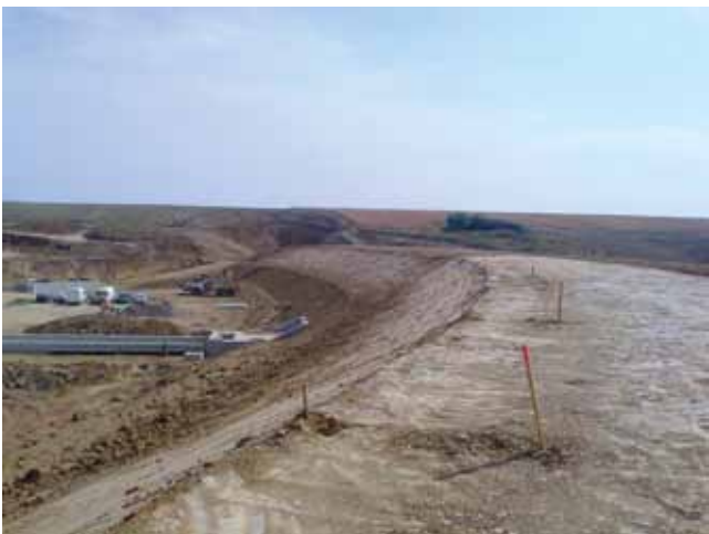
Stanje radova na brani u rujnu 2011.