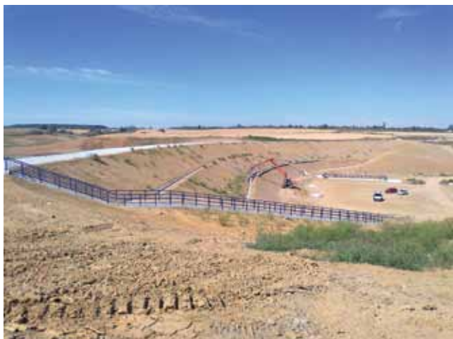
Gradilište nizvodnog dijela brane uoči našeg posjeta