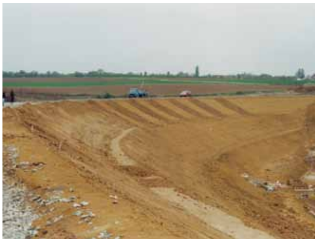
Početak završnih radova na zemljanoj brani