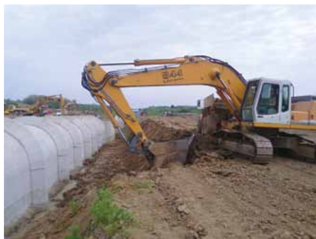
Zemljani radovi oko temeljnog ispusta