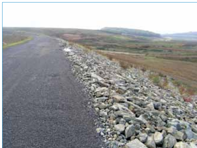
Kameni nabačaj na uzvodnom dijelu brane

na području Slavonije i Baranje. Bavi se gradnjom i održavanjem vodnih građevina još od pedesetih godina prošlog stoljeća u različitim oblicima organizacije, a 1991. je sa srodnim poduzećima iz Zagreba, Rijeke i Splita kao JVP Drava-Dunav ušla u sastav ondašnje Hrvatske vodoprivrede , danas Hrvatske vode . Od 1993. Vodogradnja Osijek registrirana je kao samostalni gospodarski subjekt, od 1997. je društvo s ograničenom odgovornošću u vlasništvu Hrvatskih voda , a od 2000. djeluje kao privatizirano dioničko društvo. Tvrtka ima dvjestotinjak zaposlenih, ali i flotu od četrdesetak plovila jer za Hrvatske vode prema četverogodišnjem ugovoru održavaju plovne putove, a posjeduju i odgovarajuću mehanizaciju za sve vrste zemljanih radova. Uključeni su u gradnju