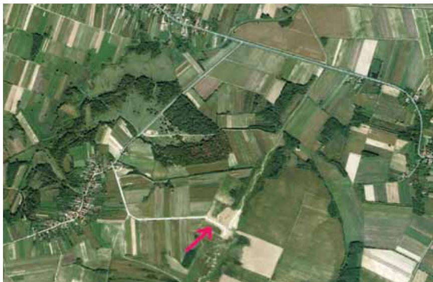
Položaj brane Koritnjak označen na satelitskoj snimci

navodnjavanje. Moguće je i dodatno iskorištavanje akumulacije za, primjerice, kavezni uzgoj ribe, športski ribolov, ali i za dobivanje električne struje (mini-elektrana). Nasuta se brana izvodi od gline, a u tijelu je brane drenažni sustav koji se sastoji od po tri drenažna tepiha s uzvodne i nizvodne strane na različitim visinama te uzdužnom drenažnom cijevi u nožici nizvodnog pokosa. Uzvodni su tepisi predviđeni za vertikalno usmjeravanje toka vode pri naglim praznjenjima akumulacije radi povećavanja odnosno osiguravanja potrebne stabilnosti brane. Nizvodni tepisi trebaju obarati procjednu liniju i stalno vlažiti pokos radi održavanja biljnog pokrivača. Kruna je brane projektirana na koti 131 m n.v., ali je zbog očekivanog slijeganja