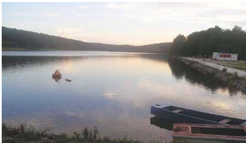
Akumulacijsko jezero Lapovac pokraj Našica (izgrađeno 1993.)

Ipak valja reći da je isušivanjem velikoga močvarnog područja i gradnjom nasipa