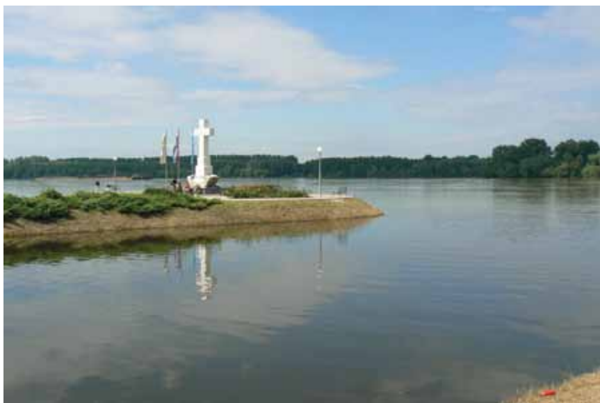
Sadašnje ušće rijeke Vuke u Vukovaru

Stanje se s planovima isušivanja močvare ipak poboljšalo nakon katastrofalne poplave 1870. kada su bila poplavljena znatno šira područja i iz vode su virili samo vrhovi drveća i trstike, a bio je onemogućen i promet na cestama koje su Osijek spajale s Đakovom i Vukovarom. Štoviše voda se zadržala gotovo godinu dana jer je korito Vuke i Kolođvarsko-bobotskog kanala bilo prepuno mulja koji je dodatno onemogućavao otjecanje. Zbog toga je vlastelin Ivan II. Kapistran Adamović pozvao iz Strasbourga cijenjenoga francuskoga vodoprivrednog stručnjaka Friedricha Wilhelma Toussainta da razgleda cijelo područje i predloži potrebne hidrotehničke zahvate. Toussaint je za tromjesečnog boravka obišao cijelo područje, uglavnom čamcem, a prošao je i područje gornje Vuke. Potom je predložio regulaciju većih razmjera te rješavanje odvodnje i isušivanje čime bi se dobilo